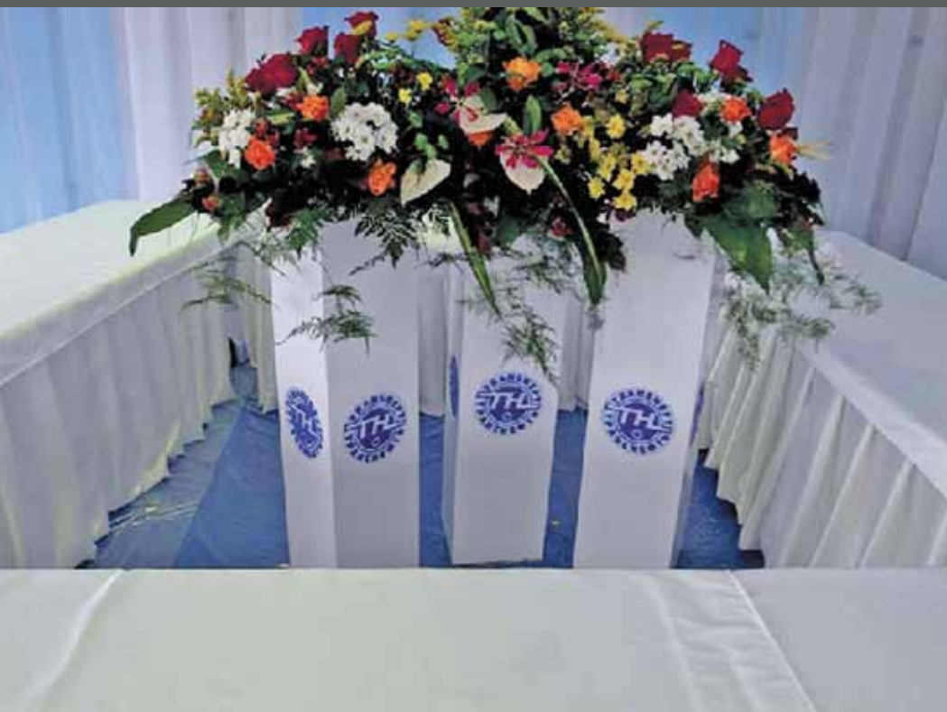
Напольная цветочная композиция

Профессионально оформленное мероприятие – прямой путь к его успешному проведению. Красивые элементы оформления, специально подобранные аксессуары и детали интерьера создают нужное настроение в помещении и будут способствовать успешному проведению переговоров и заключению сделок. Грамотное изготовление экспозиции позволяет привлечь внимание потенциальных партнеров, потребителей услуг к своей продукции. Самым важным, как показывает практика, является качество оформления мероприятия и срок монтажа. Наша компания предлагает услуги по профессиональному, дизайнерскому оформлению конференций, выставок, презентаций, особых официальных мероприятий. Наш опыт позволяет предлагать заказчикам дизайн и изготовление различных мобильных конструкций любого уровня сложности. В том числе возможно декоративное оформление тканью и флористика.