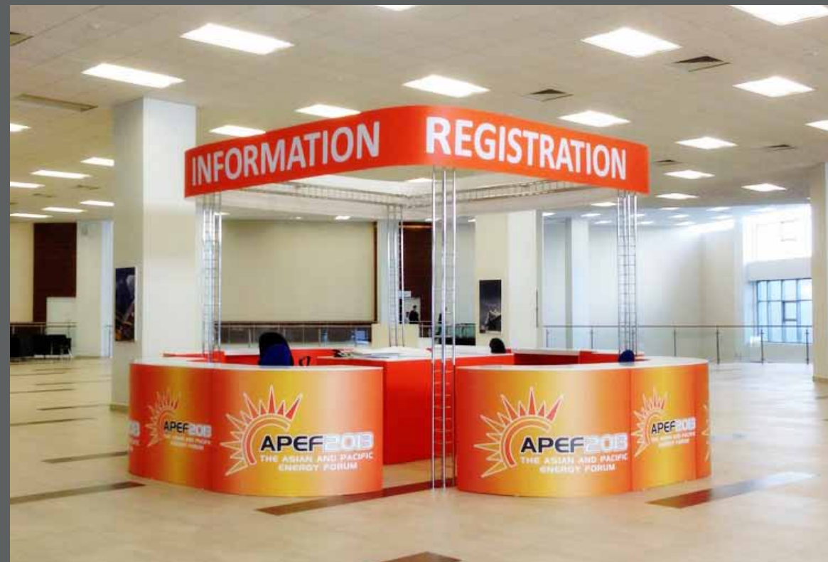
Регистрационная стойка APEF о.Русский