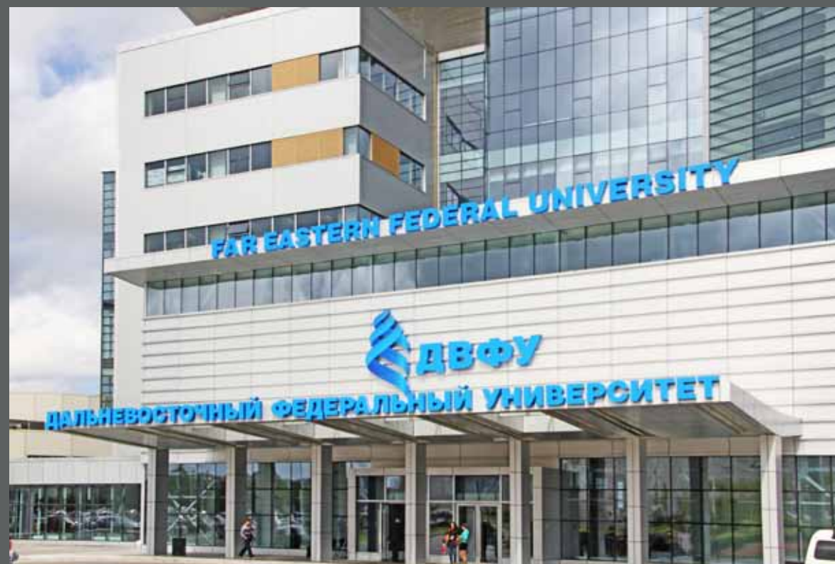
Фасадные световые буквы ДВФУ, о. Русский