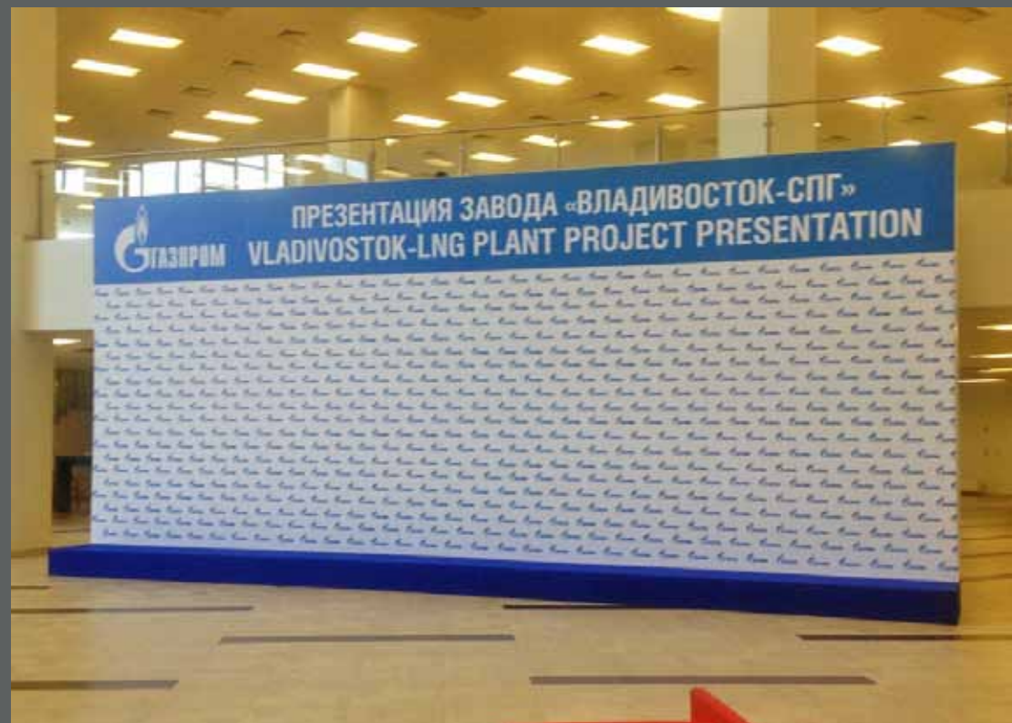
Презентация завода «Владивосток-СПГ» Газпром, о. Русский