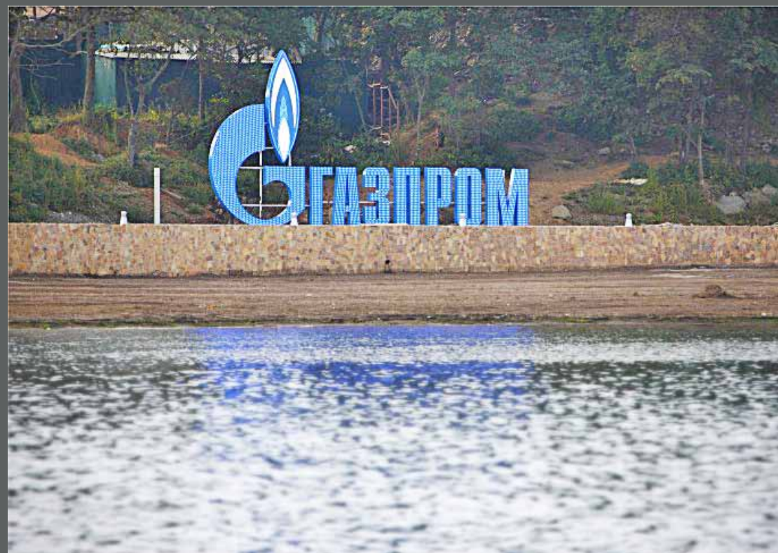
Отдельно стоящая конструкция, Газпром