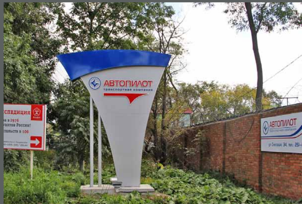
Световая стела Автопилот, ул. Снеговая, 34