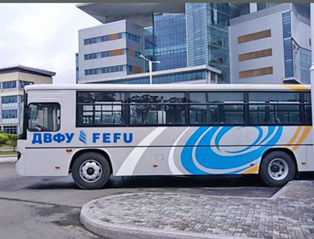
Брендинг автобусов ДВФУ