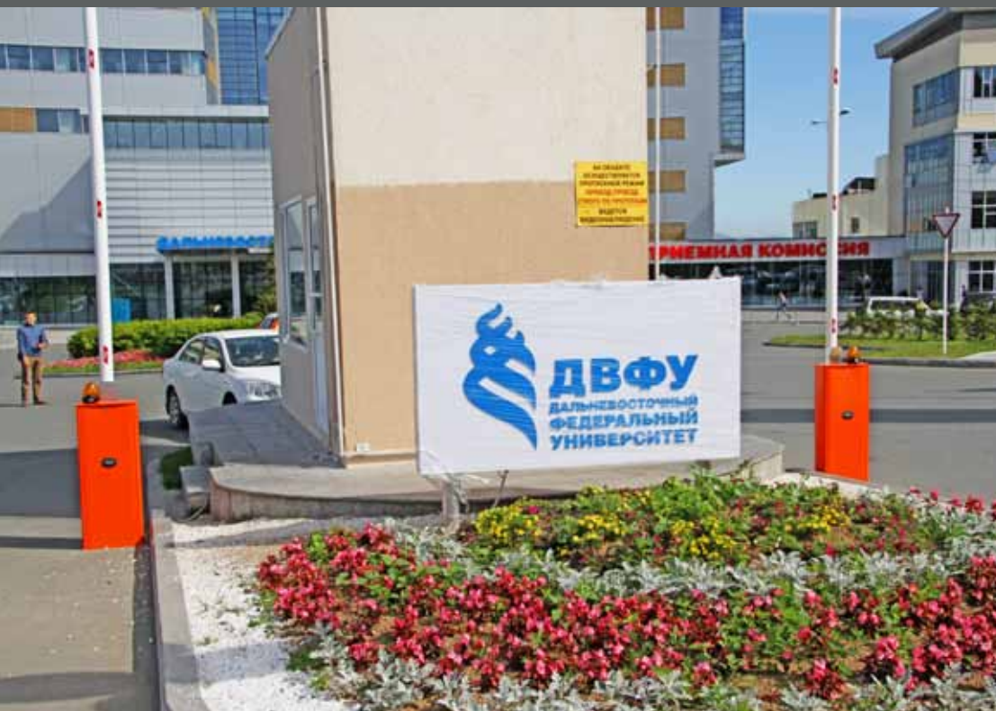
Световая стела ДВФУ, о. Русский