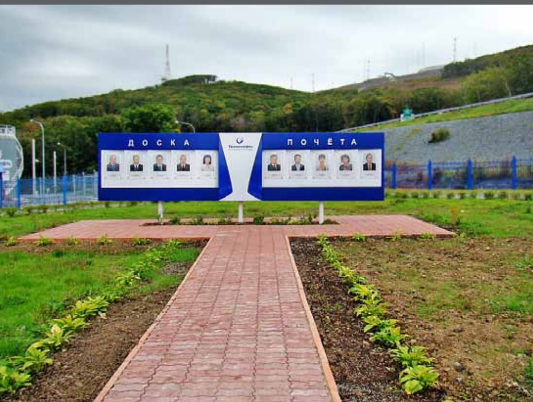
Стела Транснефть, г. Находка