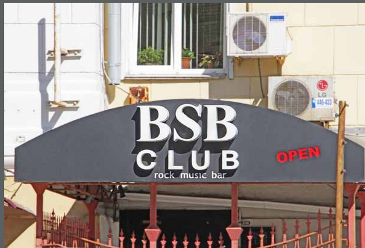
Вывеска BSB Club, ул. Суханова, 3