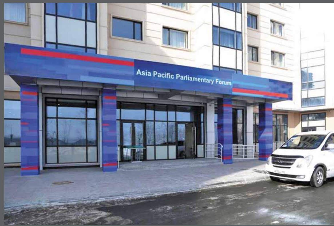
Оформление входной группы Азиатско-Тихоокеанского Парламентского форума, о. Русский