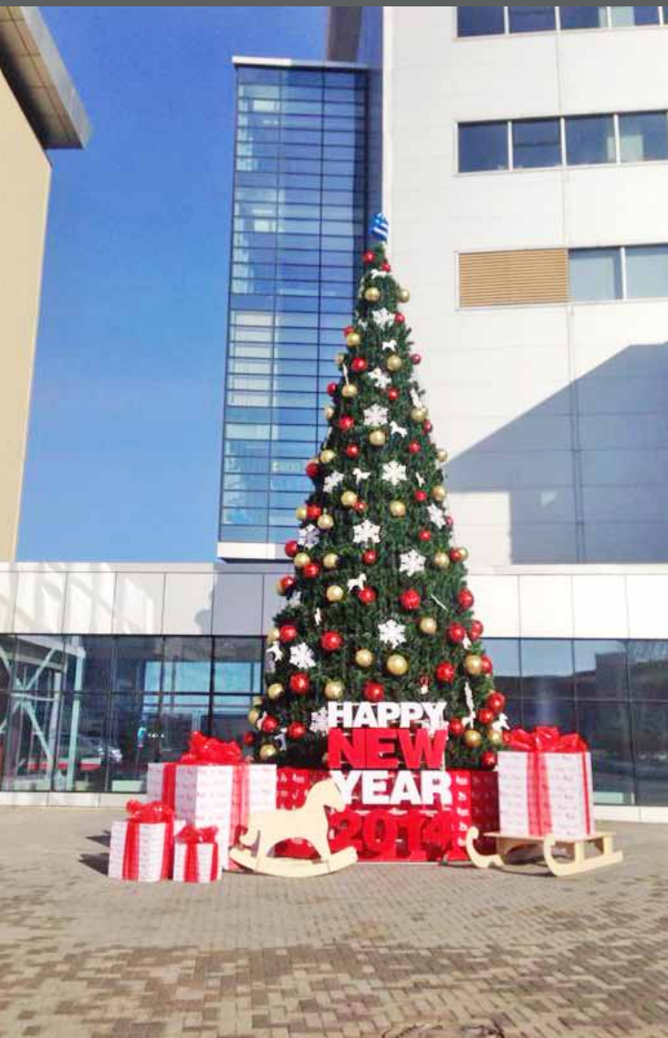
Комплексное оформление ДВФУ на Новый год, о. Русский