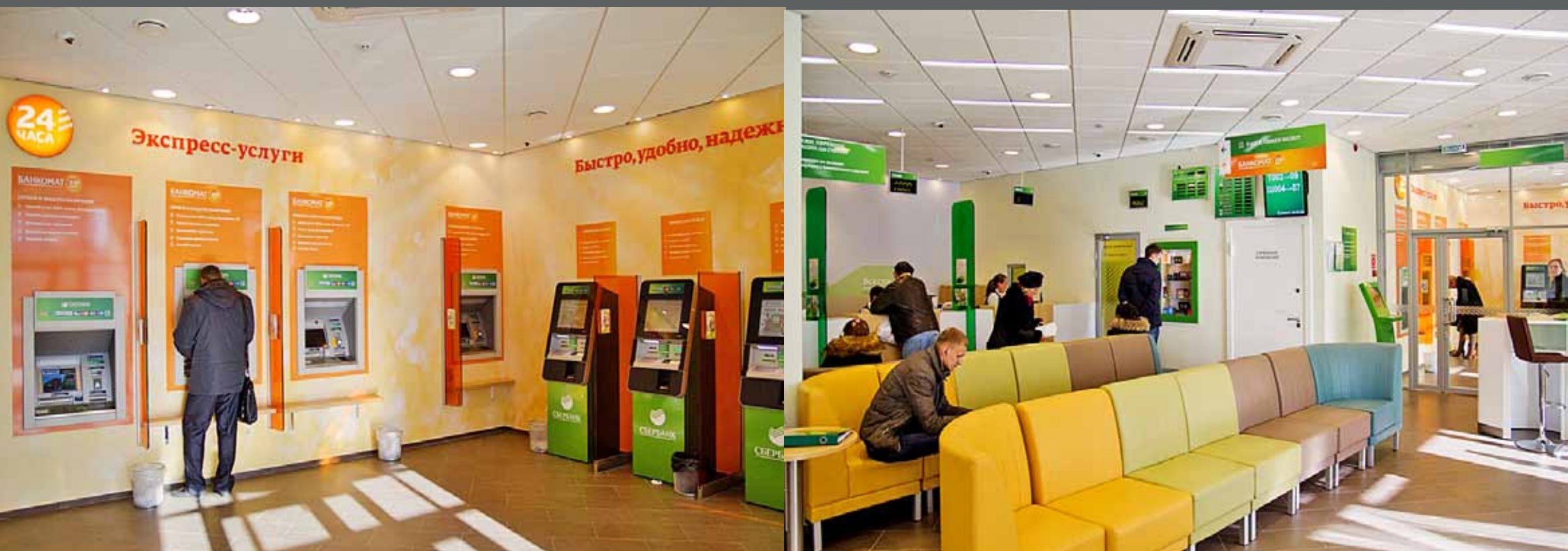
Оформление офисов Сбербанка, интерьерная навигация