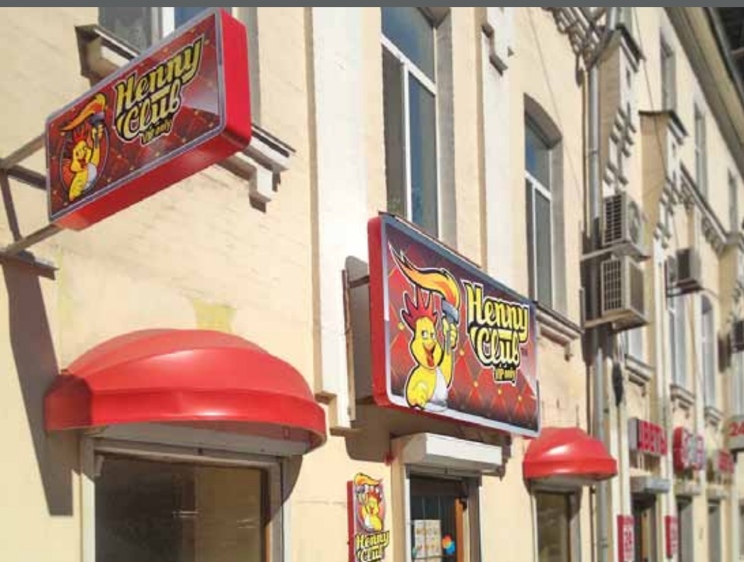
Комплексное оформление фасада Henny Club