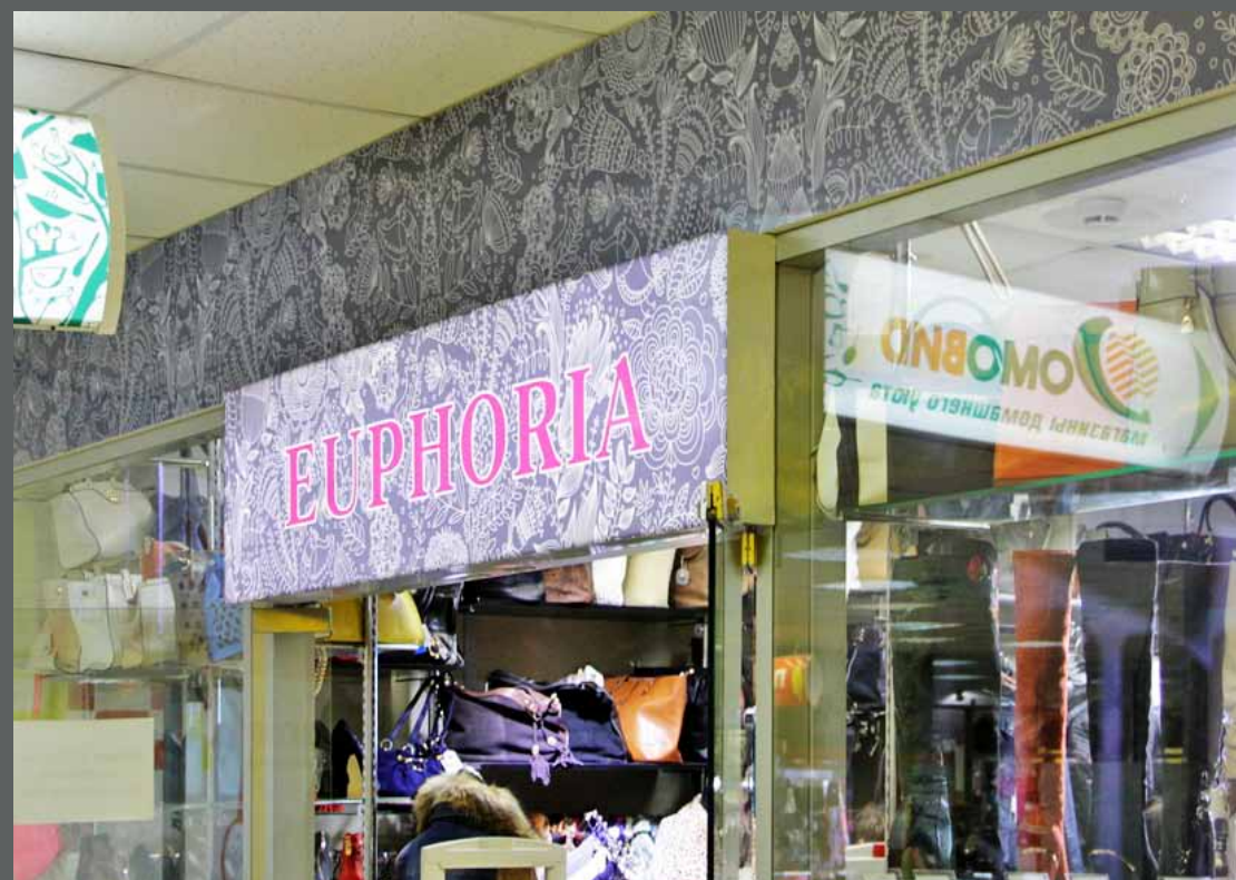
Световой короб Euphoria, ПТК Луговая