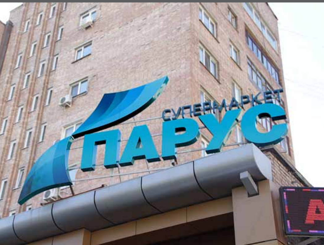
Крышная установка супермаркет Парус, Океанский проспект, 108