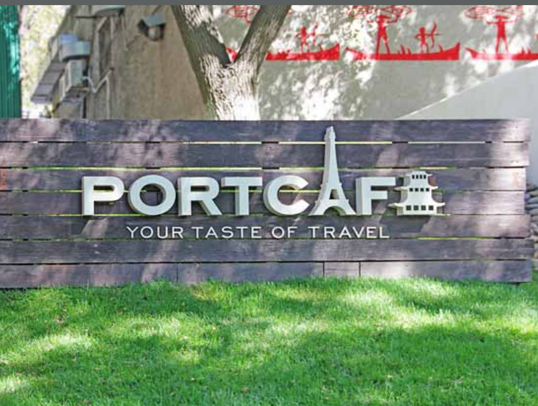
Световая вывеска PortCafe, ул. Комсомольская, 11