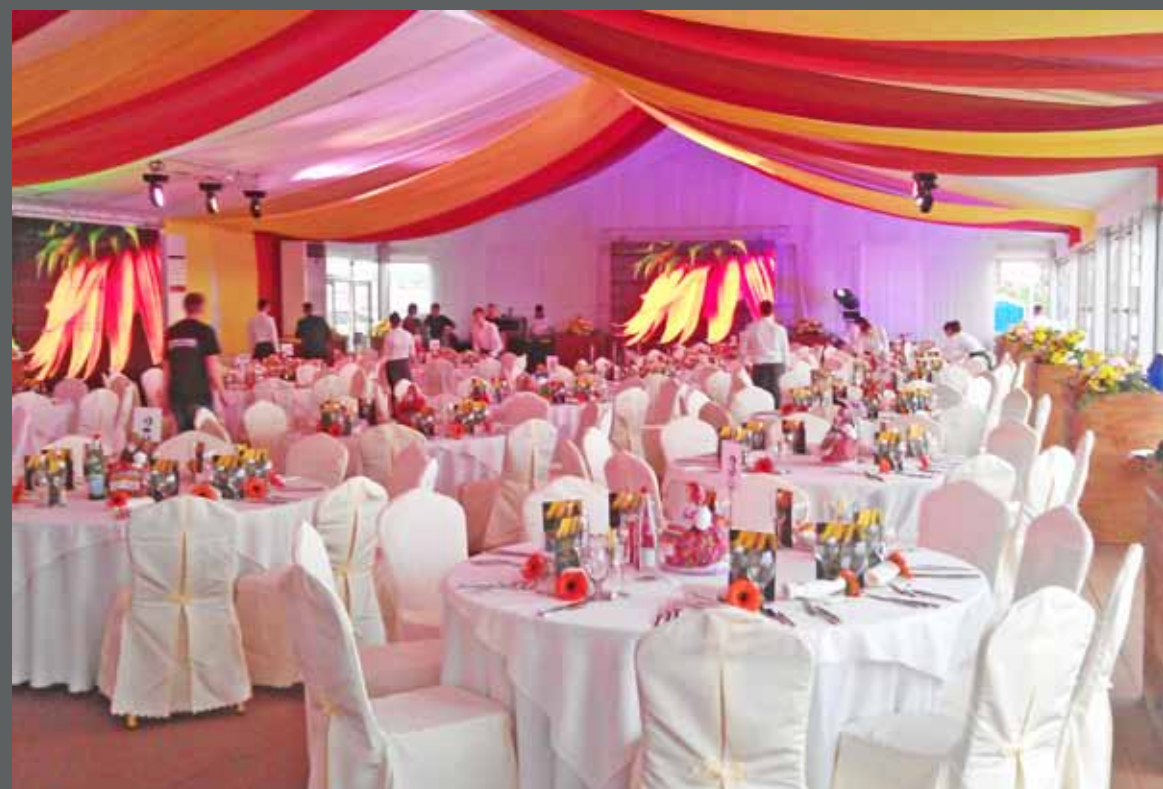
Сцена «Владивосток Гостеприимный»