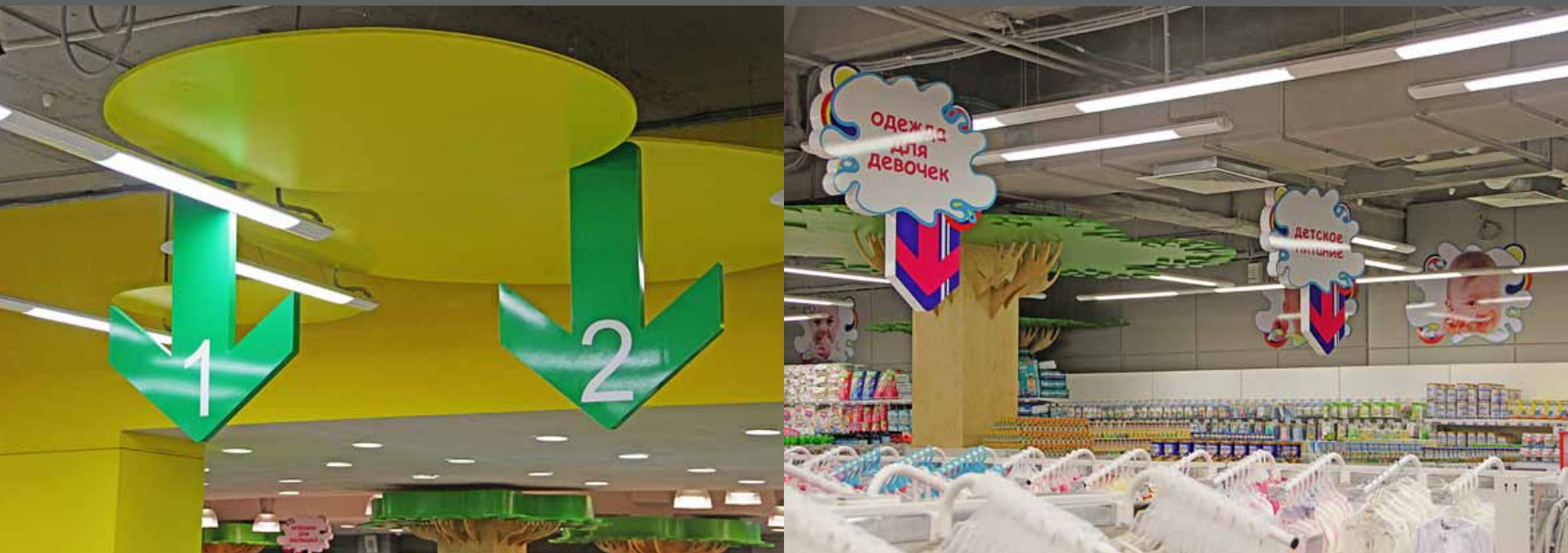
Навигация подвесная, настенная, Детская Лига, ул. Некрасовская, 94/2