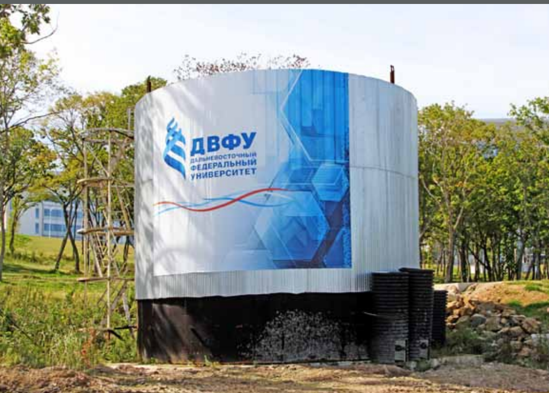
Баннер на бочку ДВФУ, о. Русский