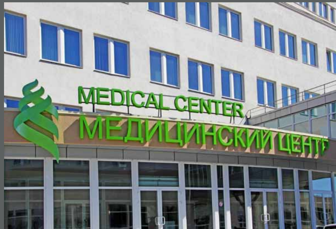
Крышная установка Медицинский Центр, о. Русский