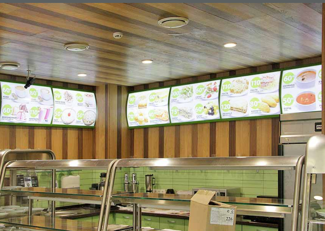
Световое меню на клик-профиле, кафе «Сад», ул. Некрасовская, 94/2