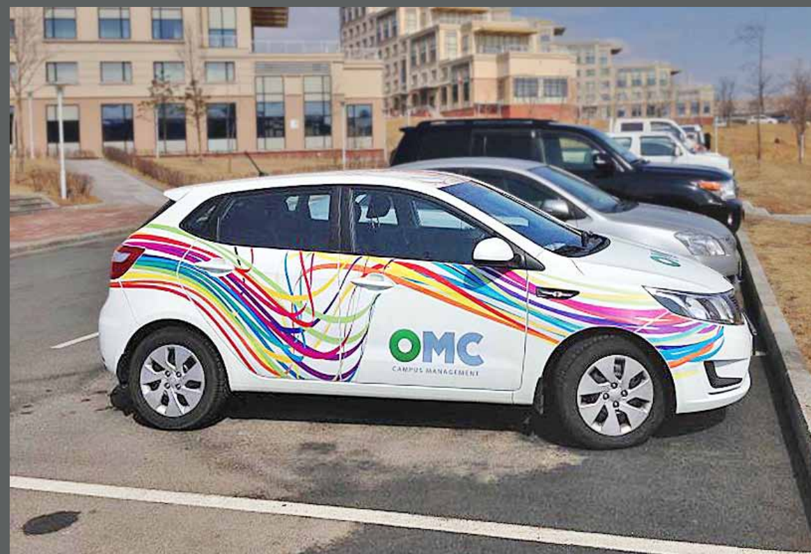
Брендинг авто OMC campus management