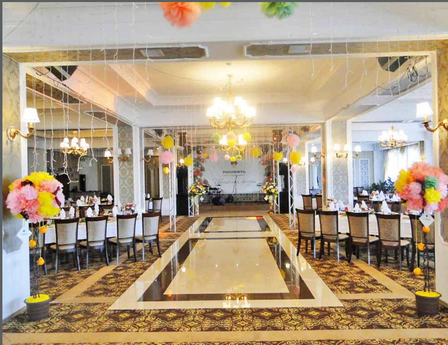
Тематическая вечеринка «Цветочная феерия», Роснефть