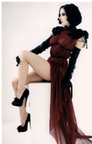
Дита фон Тиз, звезда бурлеска, фотомодел ь и актриса

В фильме участвуют суперзвезды и представители модной индустрии, чьи имена уже стали легендой