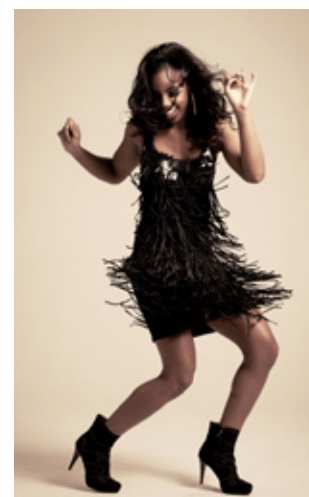
Келли Роулэнд, актриса и певица, вокалистка группы Destiny's Child