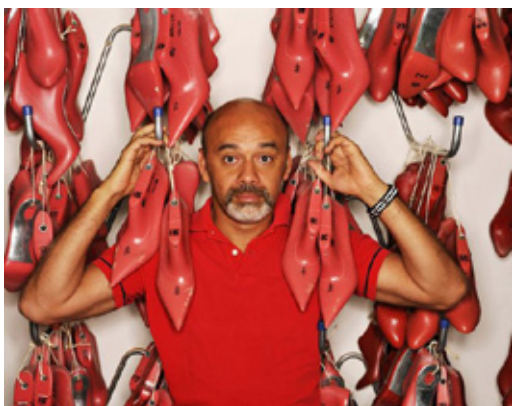
Кристиан Лубутен, французский дизайнер- модельер обуви