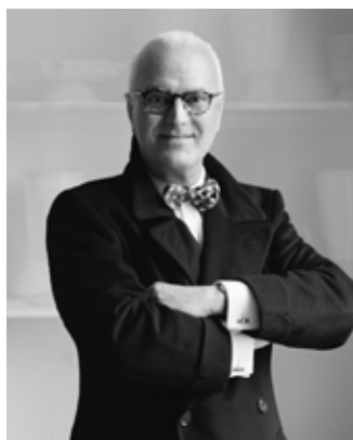
Маноло Бланик, испанский дизайнер обуви. Героиня сериала «Секс в большом городе» Кэрри Брэдшоу обожала туфли от Blahnik