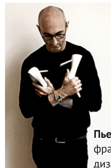
Пьер Арди, французский дизайнер обуви